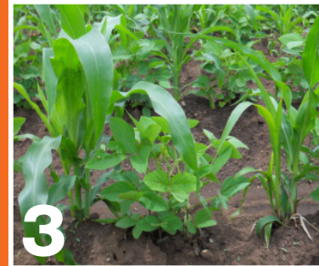
በእያንዳንዱ መስመር በቆሎና ጥራጥሬ እያፈራረቁ መትከል፤