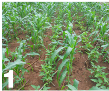
አንድ መስመር በቆሎ ቀጣይ መስመርን ጥራጥሬ እያደረጉ በማከታተል በስብጥር መዝራት፤