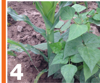
በቆሎና ጥራጥሬ ሁለቱንም በአንድ ላይ በአንድ ጉድጓድ ውስጥ መትከል፤