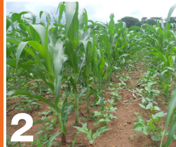
በእያንዳንዱ በቆሎ በተዘራ መስመር መካከል ሁለት መስመር ጥራጥሬ መዝራት፤